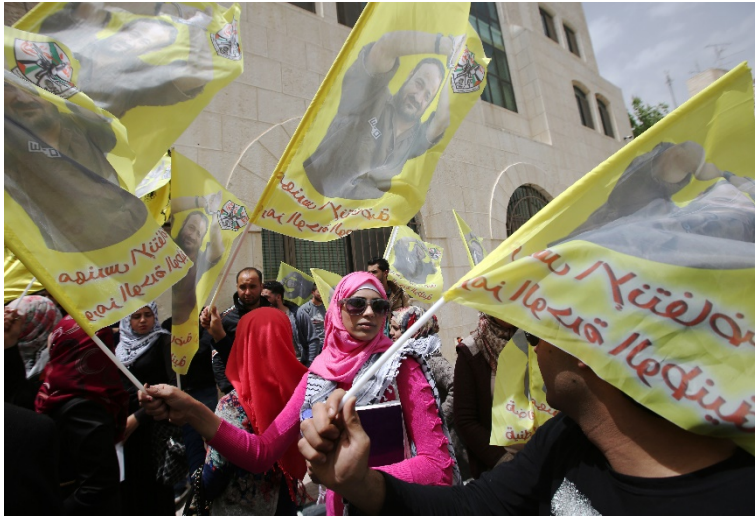
Ramallah, 15 avril 2015 - Des manifestants palestiniens brandissent des portraits du dirigeant du Fatah, Marwan Barghouti, durant la marche marquant l'anniversaire de son arrestation