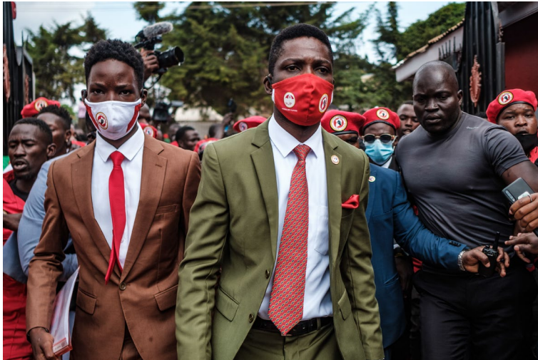
M. Robert Kyagulanyi, alias Bobi Wine, arrive au siège de son parti politique à Kampala (Ouganda), le 21 août 2020.

UGA-19 - Robert Kyagulanyi Ssentamu (alias Bobi Wine)