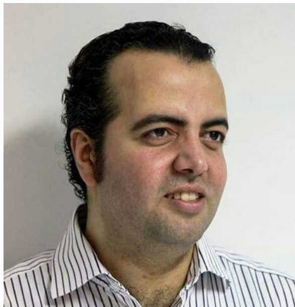
© Belady U.S. An Island for Humanity