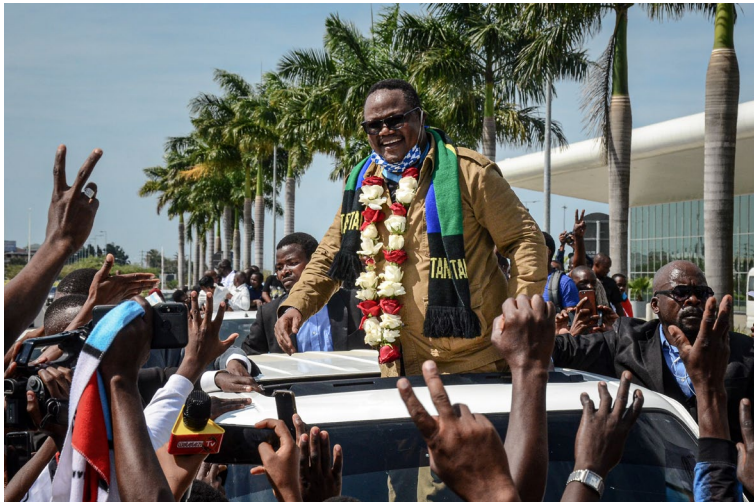
M. Tundu Lissu salue ses partisans à son retour en Tanzanie le 27 juillet 2020 après trois ans d'exil à la suite d'une tentative manquée d'assassinat le visant.