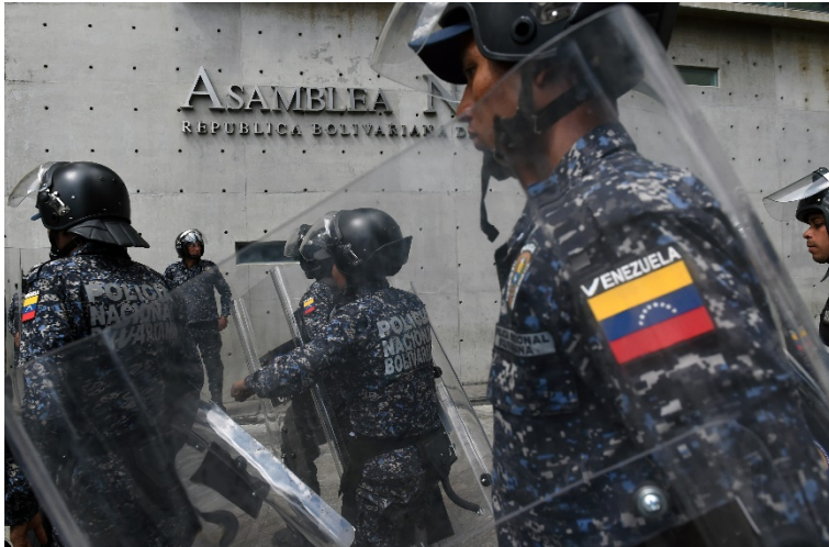
Des membres de la police nationale vénézuélienne montent la garde devant l'Assemblée nationale le 7 janvier 2020 à Caracas - Cristian HERNANDEZ / AFP