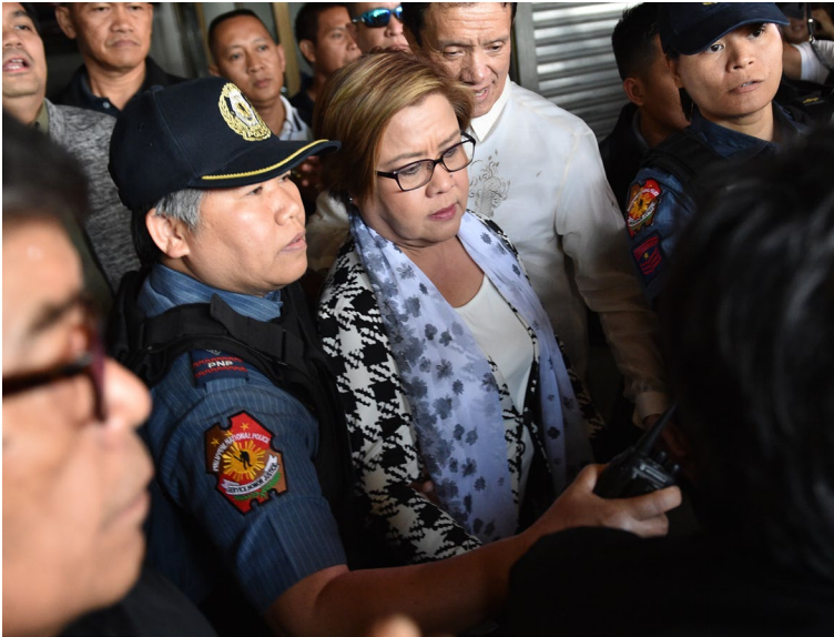
La sénatrice Leila de Lima est escortée par les policiers suite à son arrestation au Sénat, à Manille, le 24 février 2017