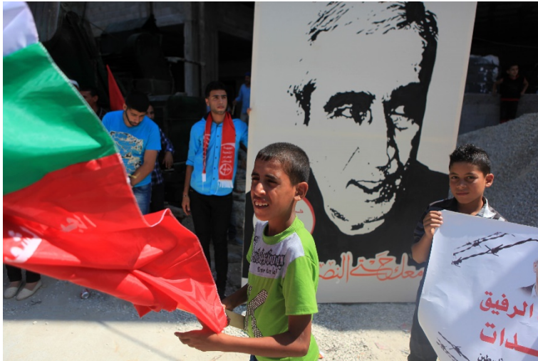
Des partisans palestiniens du Front Populaire de libération de la Palestine (FPLP) participent à une manifestation devant les bureaux du PNUD pour demander la libération d'Ahmad Sa'adat, dirigeant du FPLP, à Gaza, le 29 juillet 2015.