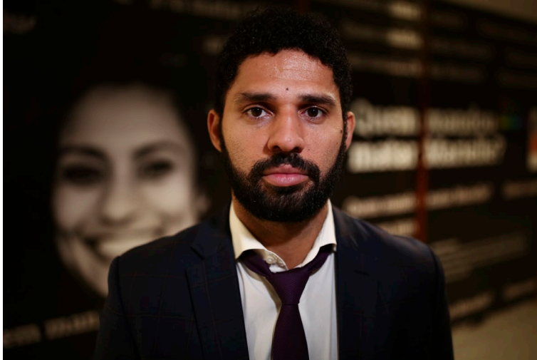
Le député brésilien, David Miranda, du Parti Socialisme et Liberté (PSOL), pose lors d'une interview donnée à l'AFP à son bureau du Congrès national à Brasilia, le 5 novembre 2019.